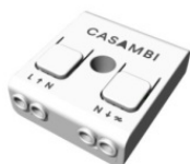
Dimmer Radio-frequenza, 85-240V