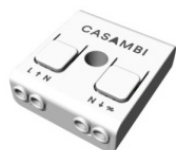
Variateur Radio-frequenza, 85-240V